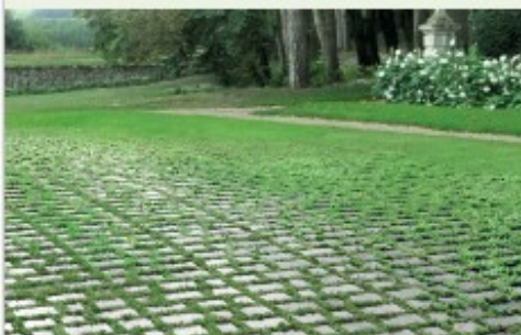
Vulcapark per PARCHEGGI VERDI Vulcapark for GRASS PARKING LOTS