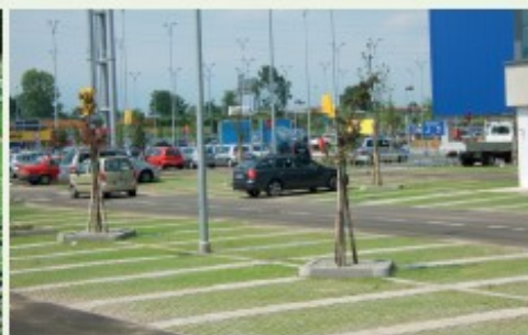
Vulcapark per PARCHEGGI VERDI Vulcapark for GRASS PARKING LOTS